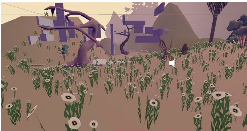
Conjunto de chanas animadas sobre as dunas

performance que um objeto estático, por exemplo, por ter textura própria e deslocamento.