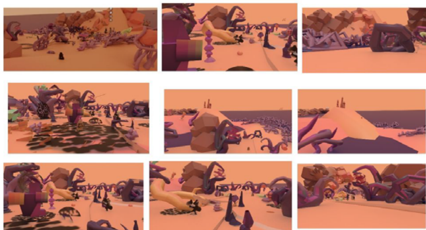
Estudos e aspectos do ambiente 3 (imagem Projeto 10 Dimensões 2025)

No mangue temos mais flores e frutos passíveis de interação com os participantes e a total influência das águas.