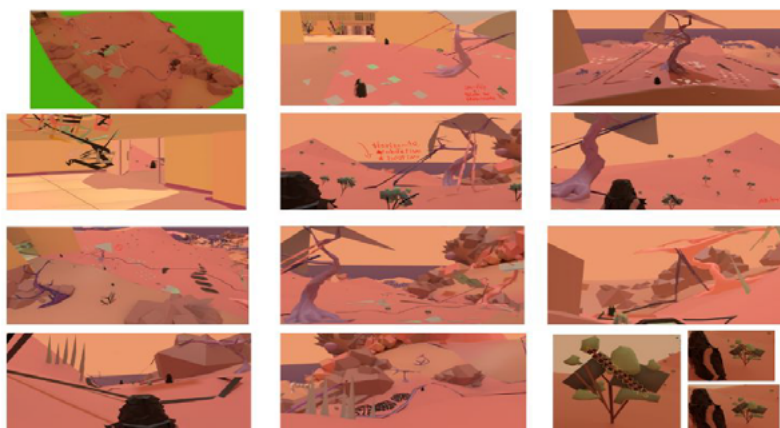
Estudos e aspectos do ambiente 1 (imagem Projeto 10 Dimensões 2025)

Este é o ambiente mais alto, conta com árvores altas, arbustos com frutas e detalhes poligonais para direcionar um caminho até o segundo ambiente, apesar do direcionamento, qualquer outra tentativa cai no segundo ambiente.