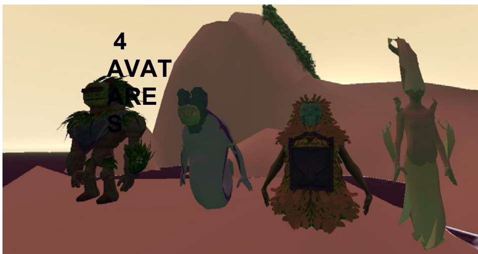
Os quatro avatares no ambiente do Metaverso

Atualizamos ou realizamos a modelagem de quatro (4) avatares inspirados em mitos dos povos originários locais, já que teremos maior quantidade de jogadores, em princípio atuando na versão para óculos Quest 3 (são 3 óculos) mais acessos via celulares e/ou computadores interagindo; logo mais será realizada a nova modelagem para a adaptação dos avatares para o novo sistema (oculus Quest 3).