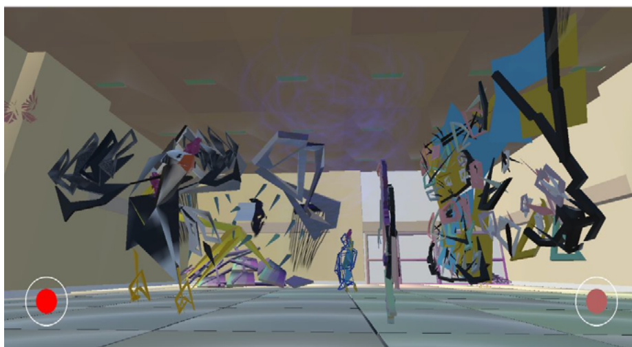
Esculturas animadas na sala da Galeria (imagem Projeto 10 Dimensões 2025)

em “tempo real”; temos como vias de acesso celulares, computadores e óculos Quest 3 (neste último, a imersão é maior, experimentada com o constrangimento da visão externa do indivíduo, inserido em um mundo artificial que torna o espaço uma totalidade ou, ao menos, a totalidade do campo visual do observador. Lembramos, porém, que o indivíduo se move no espaço físico e mobiliza ações virtuais através de gestos de seu corpo). Portanto, seja via celular, seja no ambiente físico da sala de espetáculo, o interator interage no ambiente virtual conjugadamente à sua experiência física no espaço real. O projeto teve quatro versões em espaço virtual ( https://10dimensoes.com/metaverso4/ ); estamos começando a 5ª versão para com a utilização de óculos Quest 3; assim, esta envolverá ações e atividades corporais no espaço físico que rebaterão no espaço virtual. Lembramos que a noção de metaverso, atualmente, envolve uma realidade digital em conexão com espaços de sociabilidade presencial e física, assim, abarca a interação entre espaços físicos e espaços digitais imersivos.