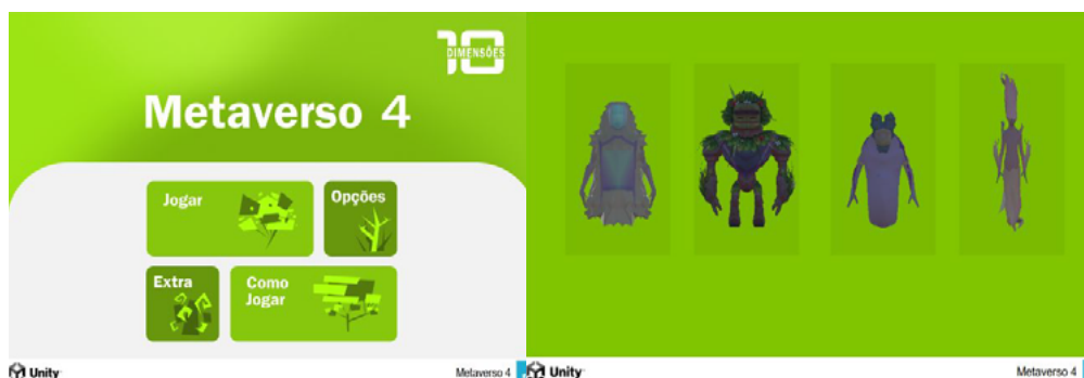
Menu inicial (imagem Projeto 10 Dimensões 2025)

3. Implementação de tela de carregamento ao selecionar o avatar.