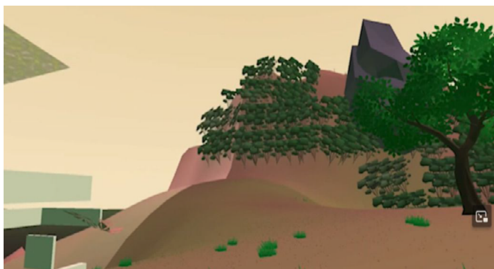
Vista do ambiente 5

Ambientes altos com maior incidência de árvores e vegetação